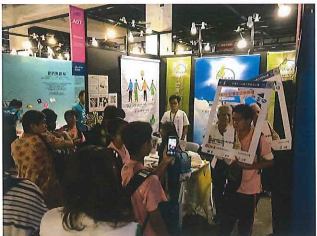
↑ 2018年10月志工輪值雜學校教育展覽。