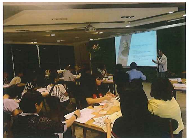
↑ 2018年10月完訓之社企推廣講師至南投南開大學於眾社企工作坊推廣尤努斯理念。