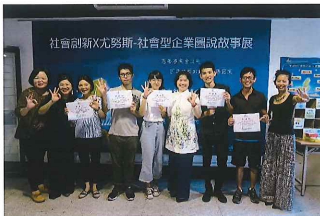
↑ 2018年8月於社會創新實驗中心舉辦社企圖說故事展暨志工聯誼，頒發志工服務證。