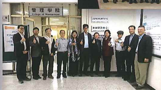
← 高雄科技大學YIBC揭牌儀式、I am here! in 4月、志工培訓&講座