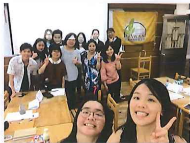
↓ 長榮大學I am here! in 8月 10月珍古德博士-永續發展講座