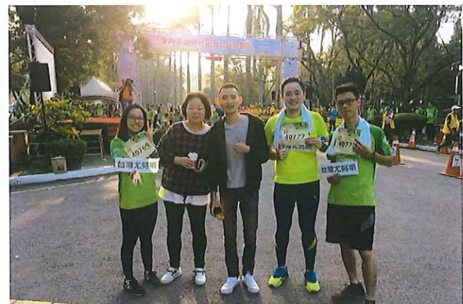
↑ 2018年10月尤努斯志工參與台中霧峰阿罩霧馬拉松競賽。