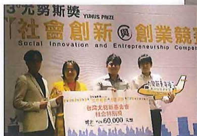
↑ 中央大學9月尤努斯獎社企特別獎暨青年種子海外培訓計劃

基金會推動全台灣10所大學成立YIBC，去年6場競賽累積71件學生社會新創提案。年度總賽「尤努斯獎」社企特別獎，提供6萬獎金送2組學生優勝至孟加拉尤努斯中心研習。基金會的社企輔育與大學的創業育成系統搭配企業界的輔育導師，將給予學生新創更務實的支援。